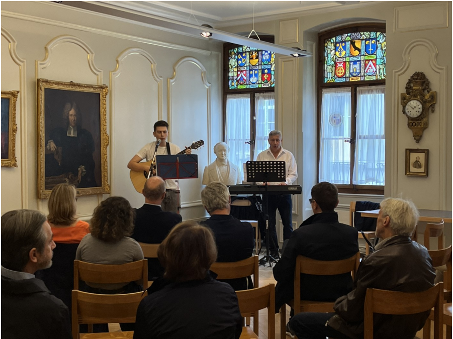
Ein musikalisches Gedicht — mit prominentem Rückenstärker