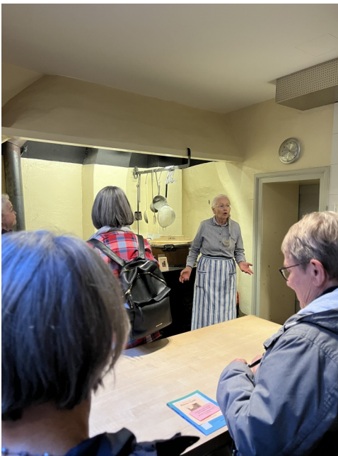
Bärner Gritli engagiert am Erzählen