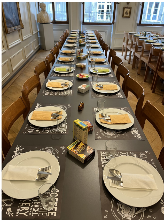
Blick in die vorbereitete Zunftstube