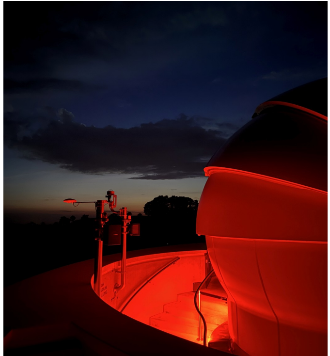
Blick auf das Teleskop von der Terrasse aus